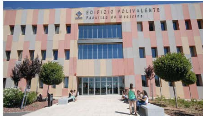
XXXV Seminario APURF Ciudad Real - Universidad de Castilla-La Mancha. Del 23 al 25 de mayo de 2019